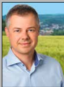
Marco Eyring Bürgermeister der Gemeinde Schlangenbad