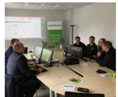
Die Kameradinnen und Kameraden bei der Einweisung in die Technik.

lel eingesetzt werden und im Gemeindegebiet sogar für einen Führungsstab betrieben werden. Im Jahresverlauf sollen nun noch die Feuerwehrangehörigen der Einsatzleitwagen-Gruppe entsprechend geschult und auf das neue Fireboard-Betriebssystem vorbereitet werden.