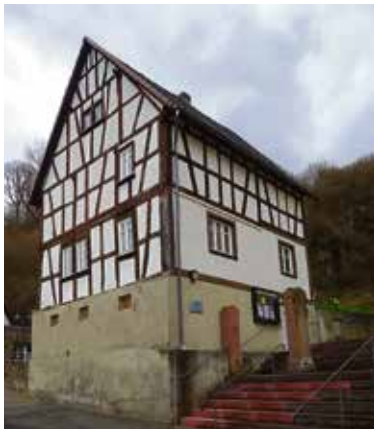
Wohnhaus in 65388 Schlangenbad-Niederglabach, Ägidiusstrasse 3

Die Kirchengemeinde Heilige Familie Untertaunus beabsichtigt im Kirchort Niederglabach das neben der Kirche gelegene Wohnhaus zu veräußern. Die Wohnraumgrundfläche beträgt ca. 105 qm bei einer Raumhöhe von