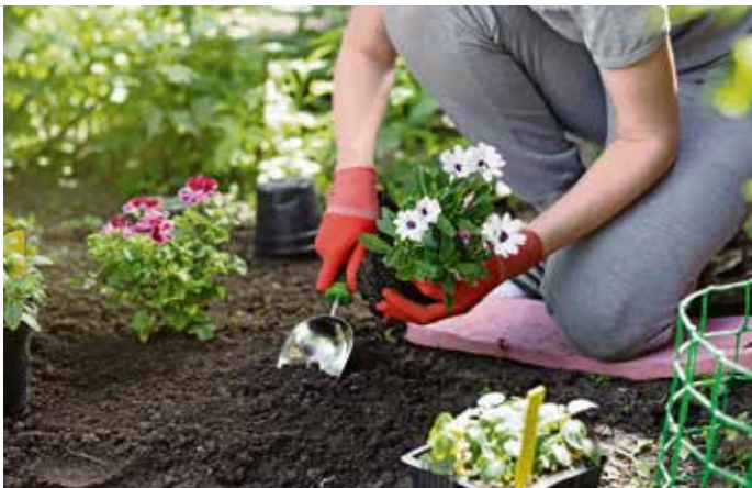
Gärtnern mit gutem Gewissen: Zu Torf gibt es mittlerweile viele umweltfreundliche Alternativen.

Alternativen ohne Torf ist vielfältig. Entsprechende Produkte sind im örtlichen Handel mit eindeutigen Aufdrucken wie „torffrei“ oder „ohne Torf“ auf der Verpackung gekennzeichnet. Unter www.torffrei.info informiert die Fachagentur Nachwachsende Rohstoffe e. V. (FNR) zu knapp 300 entsprechenden Produkten, die in Deutschland erhältlich sind, und gibt nützliche Tipps für das Gärtnern ohne Torf.