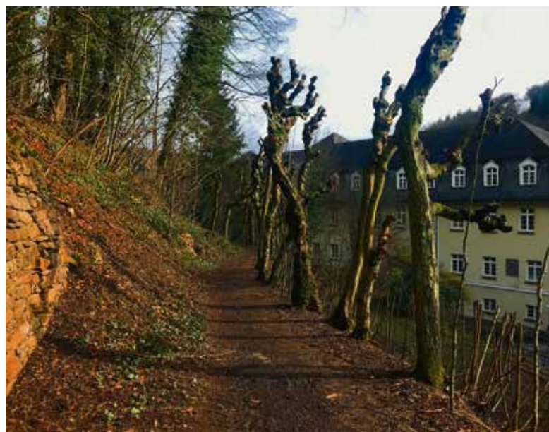
Nach den Baumpflegearbeiten hat die Hainbuchenallee wieder Platz für neues Wachstum im Frühjahr.

Für den Sommer ist eine Aktion des Ortsbeirates geplant, die Holzbänke an der Hainbuchenallee zu strei-