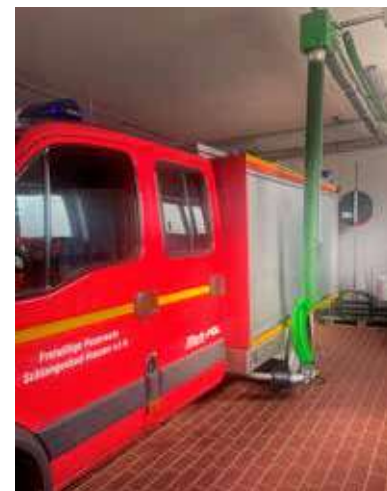
Die Abgas-Absauganlage im Feuerwehrhaus in Hausen v.d.H.