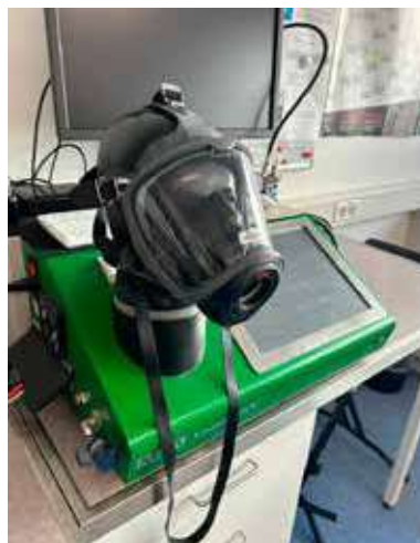
Die neuen Atemschutzmasken „G1“ der Firma MSA auf dem „Prüfkopf“ bei Wartungsarbeiten.

Eine weitere größere Summe investierte die Gemeinde in die Ersatzbeschaffung von Atemschutzmasken. Hier musste durch die Einstellung der Ersatzteilversorgung durch den Hersteller Ersatz beschafft werden. Zur Verwendung kommen jetzt knapp 60 Überdruckmasken des Modells G1 des Herstellers MSA. Bei den Überdruckmasken herrscht im Inneren der Maske im Gegensatz zu Normaldruckmasken ein leichter Überdruck. Somit wird verhindert, dass bei kleineren Undichtigkeiten beim Maskensitz giftige Stoffe ins Maskeninnere einströmen können.