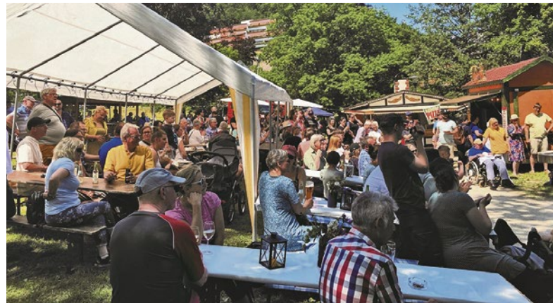
Gespannt lauschen die Gäste den Darbietungen am Weinfest.