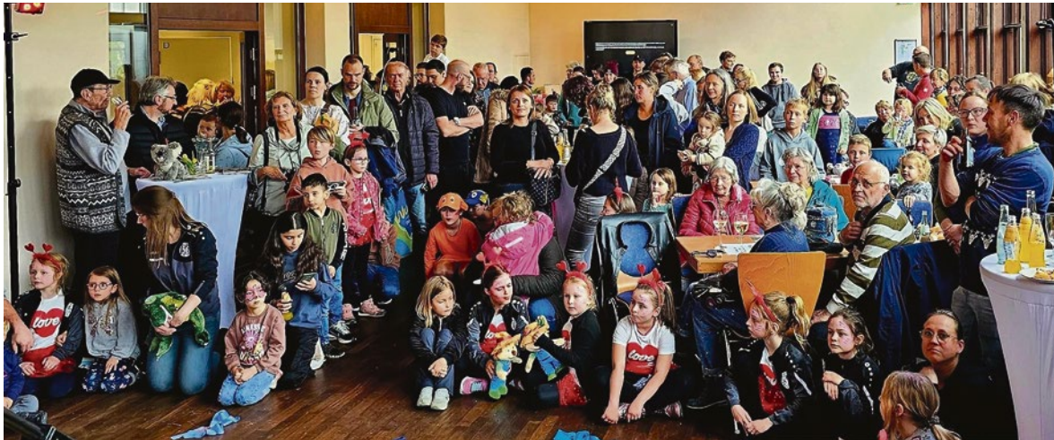
Ein voller Erfolg: Die Gemeinde Schlangenbad feiert die Premiere des Frühlingsfestes in der Historischen Caféhalle.