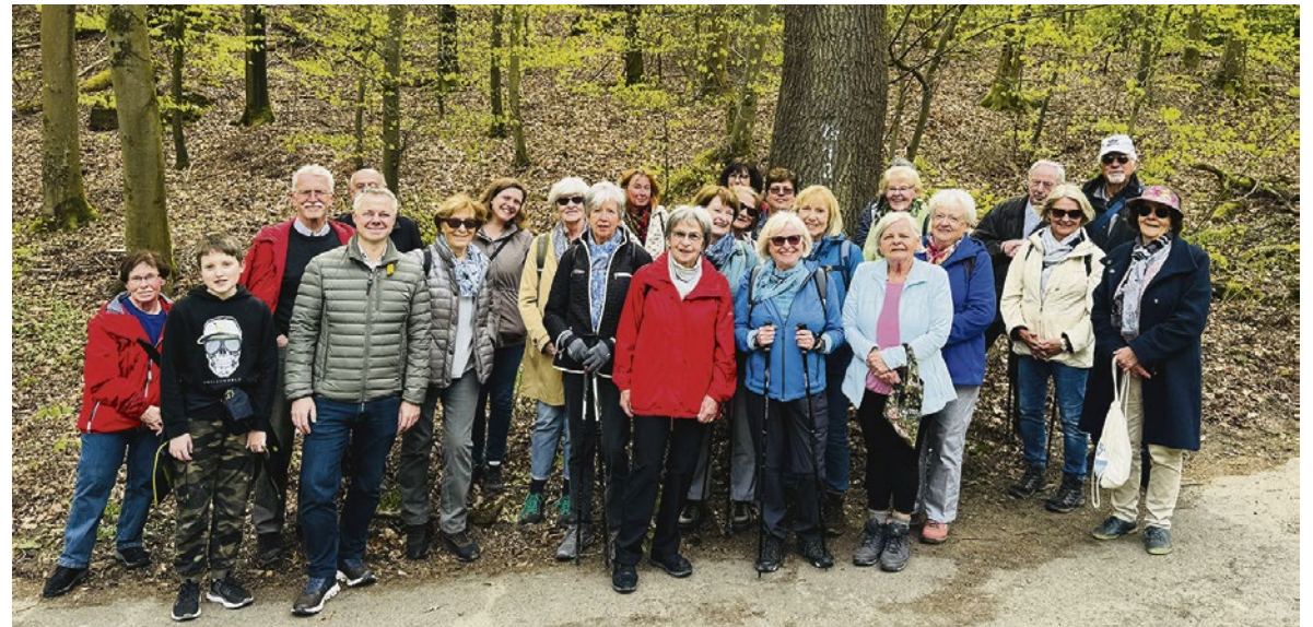
Gelungene Premiere: Die 1. „Spazierwanderung“ nach Rauenthal begeisterte knapp 30 Teilnehmer.