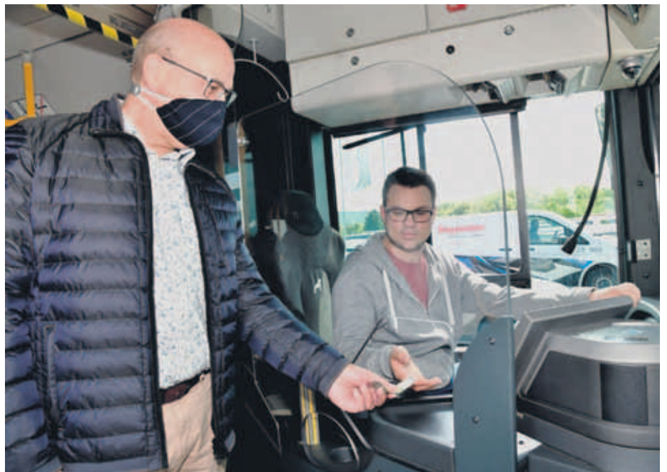
Fahrerkabine mit Schutzscheibe.

zirka 130.000 Euro monatlich verzeichnen. „Dementsprechend sind auch wir froh, wenn die Einzelfahrscheine auch wieder über die Busfahrerin oder den Busfahrer verkauft werden. Den Service, Einzelfahrscheine zum direkten Fahrtantritt auch in den Vorverkaufsstellen zu erwerben, lassen wir bis auf weiteres als zusätzliche Option für unsere Fahrgäste bestehen. Natürlich können die Tickets auch kontaktlos über die RMV App, Mein RMV oder RMV Smart erworben werden.“ führt Brunke weiter aus.